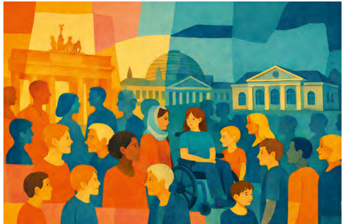
Jahrestagung „Demokratie schützen – Demokratie stärken“ in Weimar

Was ist ein gutes Leben? Mit dieser Frage startete der Deutsche Ethikrat bereits im Herbst 2025 eine Aktion mit Schülerinnen und Schülern, die im November 2026 in seine Herbsttagung mündet. Unter dem Titel „Triff den Ethikrat! Eure Vorstellungen vom guten Leben“ will der Rat am 11. November 2026 in Leipzig mit jungen Menschen ins Gespräch kommen. Grundlage dafür sind kreative Einsendungen junger Menschen, die in Form von Podcasts, Videos, Comics oder anderen Ideen ihre Vorstellungen von einem guten Leben heute und in Zukunft thematisieren. „Die Frage nach dem guten Leben