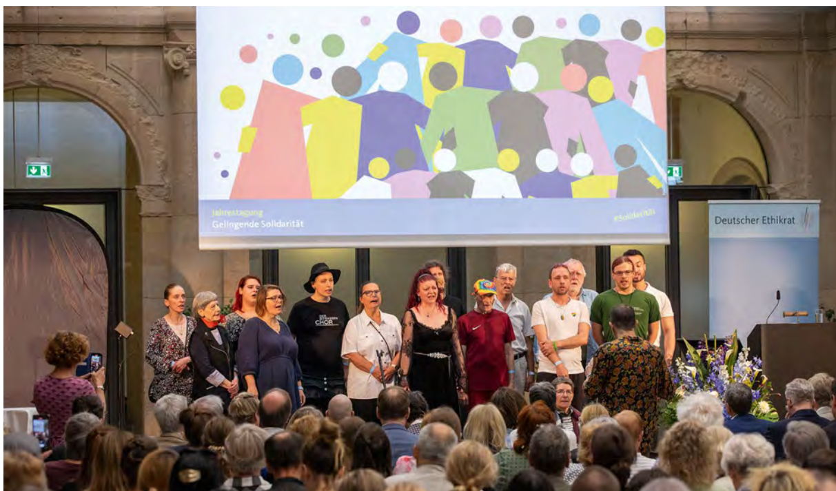
▲ Straßenchor Berlin bei der Jahrestagung des Deutschen Ethikrates zum Thema „Gelingende Solidarität“

Polarisierung, soziale Ungleichheiten und globale Krisen stellen den gesellschaftlichen Zusammenhalt auf die Probe. Wie kann Solidarität dennoch gelingen? Diese Frage war Dreh- und Angelpunkt der Veranstaltung. Dabei thematisierte der Rat gemeinsam mit den geladenen Expertinnen und Experten sowie dem Publikum, unter welchen Voraussetzungen solidarisches Handeln möglich wird, wo Solidarität an ihre Grenzen stößt und was wir tun können, um diesen Herausforderungen zu begegnen. Die Tagung war innerhalb von zwei Tagen ausgebucht. 250 Menschen verfolgten die Veranstaltung vor Ort in Berlin, knapp 1.500 im Livestream. Neben den Vorträgen und Diskussionsrunden gab es auch künstlerische Beiträge, wie beispielsweise einen Auftritt des Straßenchor