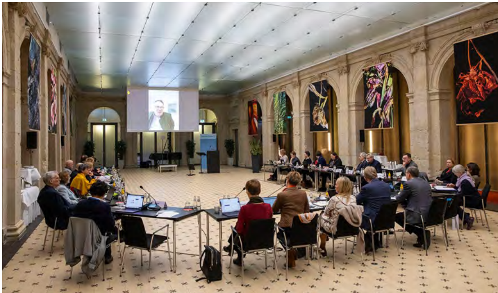
◀ Ratssitzung am 23. Januar 2025